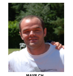
MAYR CH. 63 61